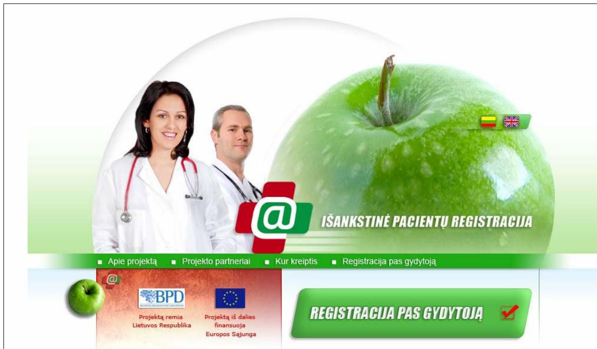
1 pav. www.sergu.lt pagrindinis puslapis

Atsidariusiame lange pelės mygtuku spaudžiama nuoroda „Registracija pas gydytoją“.